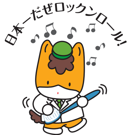
群馬県のマスコット「ぐんまちゃん」